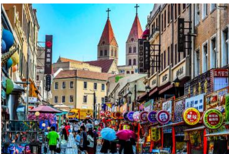
ถนนวาชาน