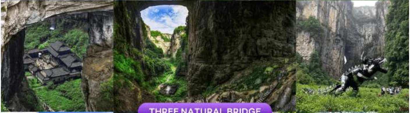
THREE NATURAL BRIDGE