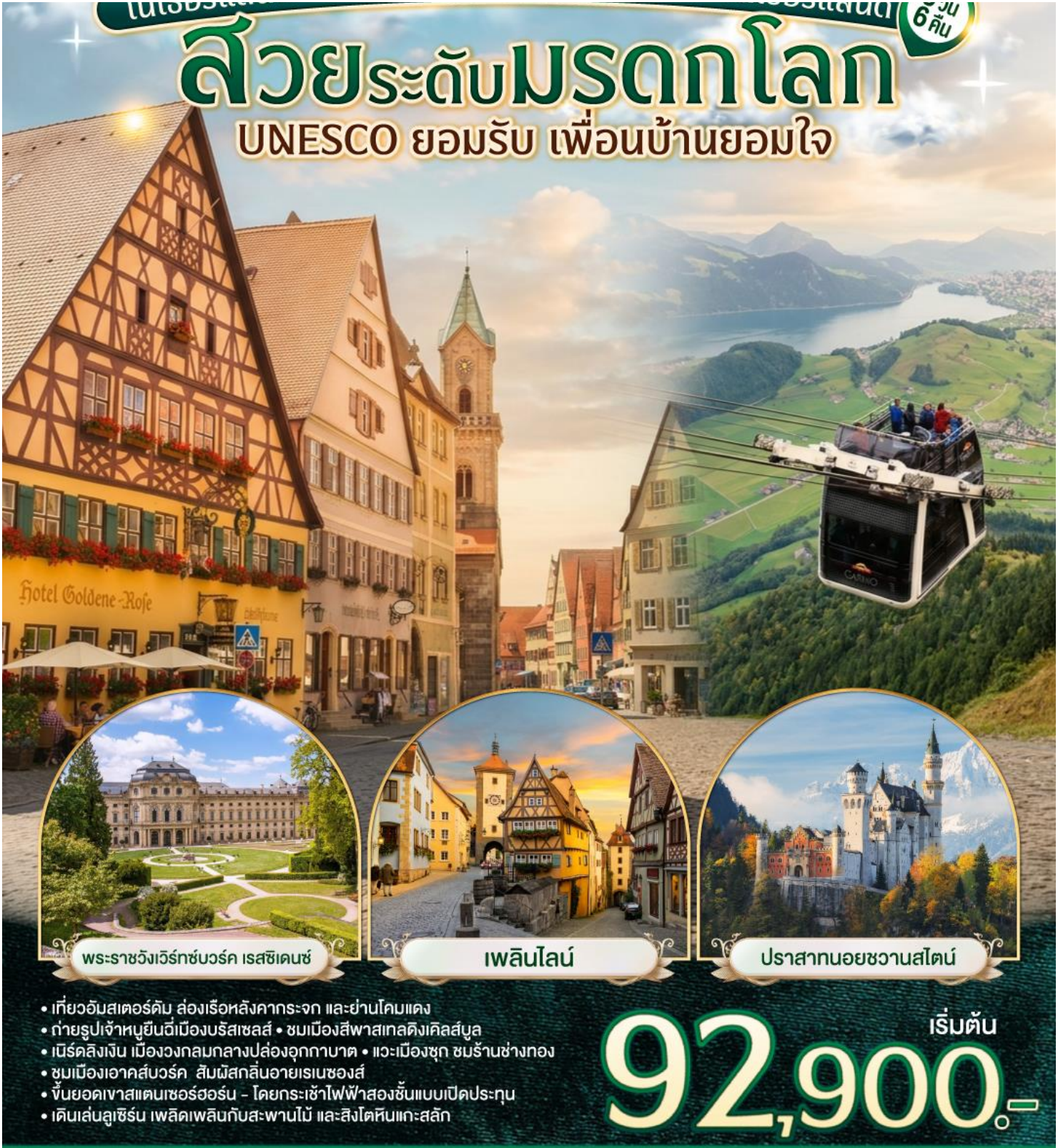
พระราชวังเวิร์ทซ์บวร์ค เรสซิเดนซ์