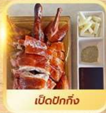
เปิดปีกทั้ง