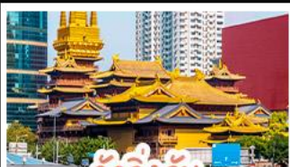
วัดจิ้งอัน

ล่องเรือสุดโรแมนติกแม่น้ำหวงผู่ จัตุรัสเทียนอันเหมิน จัตุรัสใหญ่ที่สุดในโลก ใจกลางประวัติศาสตร์จีน พระราชวังต้องห้าม พระราชวังโบราณสุดอลังการ มรดกโลกยูเนสโก ถนนนานกิง แหล่งช้อปปิ้งสุดฮิต แบนด์เนม ของฝากเพียง