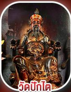
วัดปึกไต้