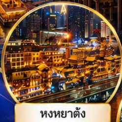
หงหยาดิ่ง