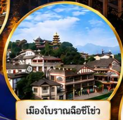
เมืองโบราณเฉิงชิว