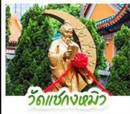
วัดเซ่งก้งเมิว