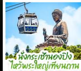
เน็กระเซ้าเองปิง ไฮว้พระใหญ่เทียนถาน