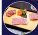
บุฟเฟ่ต์ ซาบุสโตลิตญี่ปุ่น