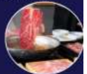
ปิ้งย่างพรีเมียม ROKKASEN เนื้อคุณภาพ