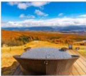
ดิโยซาโตะเทอเรส