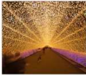
นาบะนะโนะซาโตะ