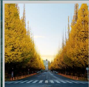
“ICHONAMIKI GINGO AVENUE”