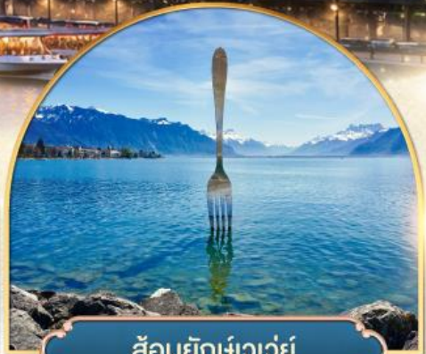
ล้อมยึกเขาวัว