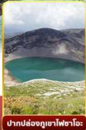
ปากปล่องภูเขาไฟซาโอ