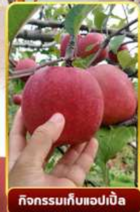
กิจกรรมเก็บแอปเปิ้ล