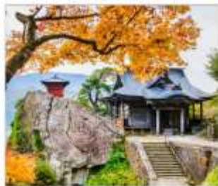
วัดยามาเดระ