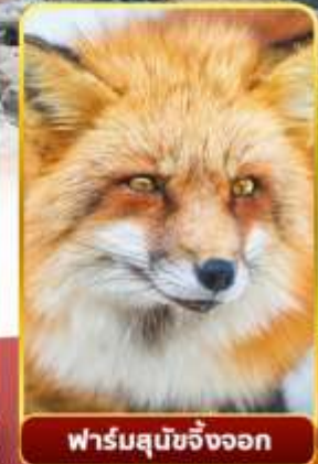
ฟาร์มสุนัขจิ้งจอก

ออนเซน 4 คืน | นน.กระเป๋า 23 กก.X2 | 8Days 5Night