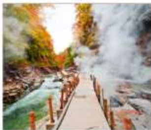
ซุนเขาโอยาสึเดียว