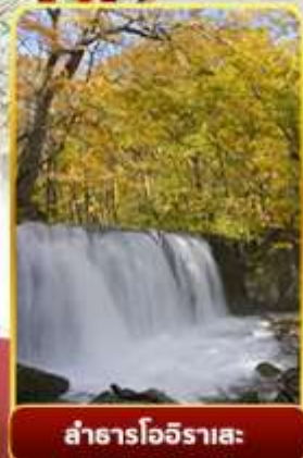
ลำธารโออิราสะ