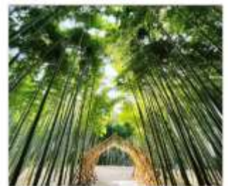
ป่าไฟวากายามะ