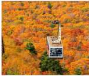
นั่งกระเช้าซึกโกดะ