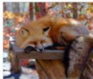
ฟาร์มสุนัขจิ้งจอก