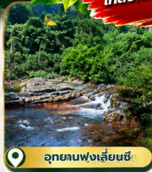
อุทยานฟ่งเลี่ยนซี