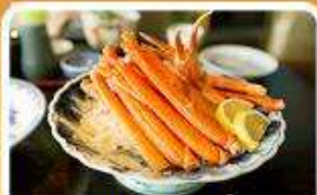
พิเศษ! ชาปู