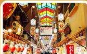
ตลาดปลาเนฮิงะ