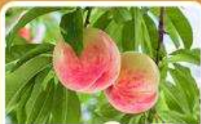
กิจกรรมเก็บผลไม้