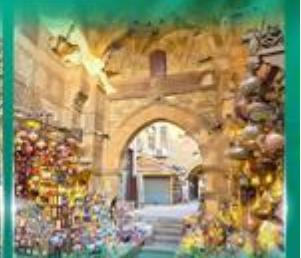
ตลาดผ่านเวลาอัลลี