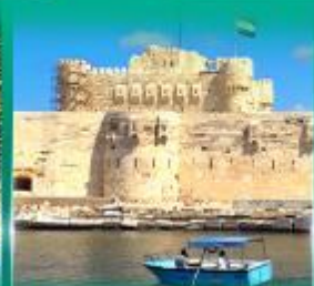
บึงนราการ Qulte Bay