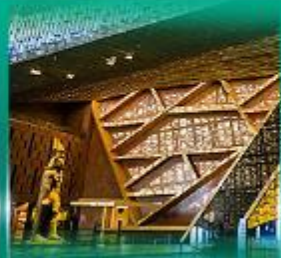
พิพิธภัณฑ์แกรนด์อียิปต์ (GEM)