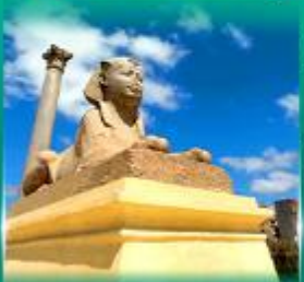
เสานินบงเบญ