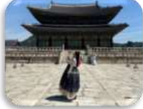
พระราชวังเคียงบก