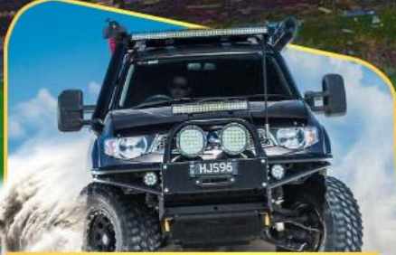
คันรถ 4WD สู้อีกลางเทือกเขาคอเคซัส