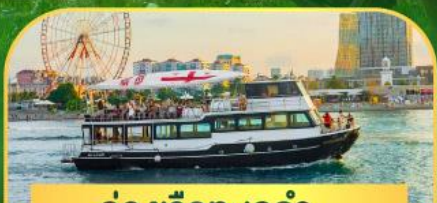
ล่องเรือทะเลดำ