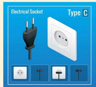
ปลั๊กไฟที่ใช้ที่อียิปต์