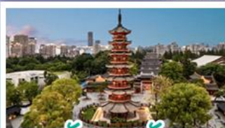
วัดเลงเซ้ง