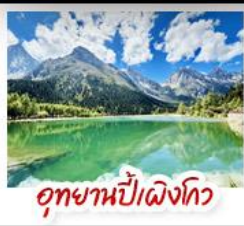
อุทยานปี่เฉิงโกว

มรดกโลกพระพุทธรูปแกะสลักหินต้าวู้ - อุทยานหลุมบ่อฟ้าสะพานสวรรค์ อุทยานเขานางฟ้า - หงหยาดัง - ดิกยูชิง ชั้น 22 - ชมรถไฟฟฟ้าทะลุค สะพานโบราณหนานเฉียว - เมืองโบราณกวนเซี่ยน - อุทยานภูเขาสี่ดรุณี อุทยานปี่เฉิงโกว - ถนนโบราณชอยกวางชอยแคบ - วัดต้าอ้อ ถนนคนเดินซุนซีลู่ - หมู่เพนด้าปิ่นตักIFS - ถนนไท่กุ่หลี่