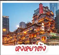
ตงเฉียวตั้ง