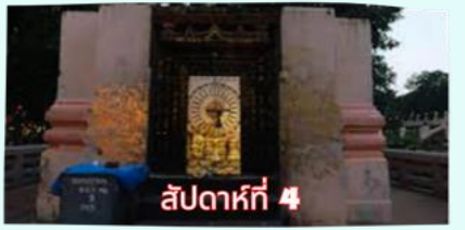
รัตนขรเจดีย์ (ซุ้มเรือนแก้ว)

เรียบร้อยแล้ว นำคณะจาริกบุญสวดมนต์ทำวัตรเย็น บูชาพระรัตนตรัย และสวดมนต์บูชาสังเวชนียสถาน จากนั้นเชิญท่านทัศนารธรรม นั่งสมาธิปฏิบัติบูชาตามอธยาศัย สมควรแก่เวลา นัดหมายเวลาเชิญท่านกลับโรงแรมที่พัก