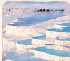
PAMUKKALE ปานุกคาล่า