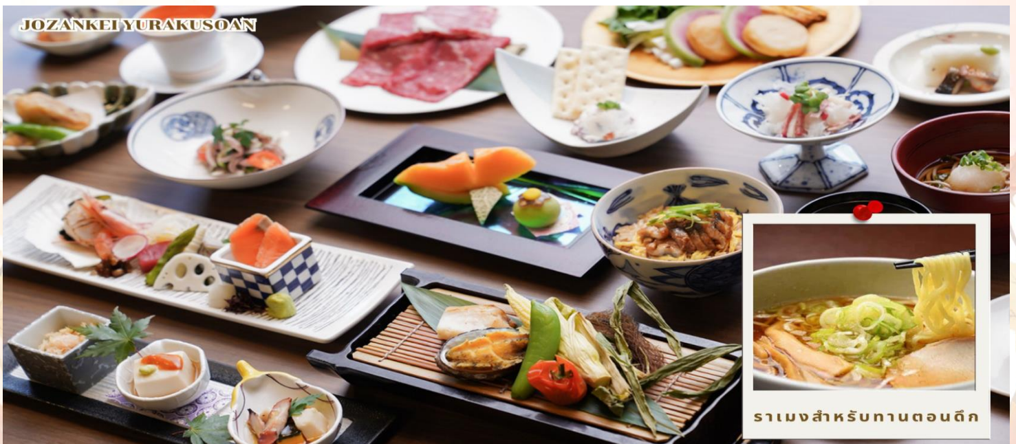
ราเม็งสำหรับทานตอนดึก

ค่า รับประทานอาหารค่ำ ณ ห้องอาหารของโรงแรม (มื้อที่ 5)