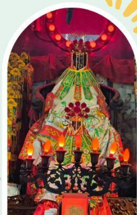
วัดเจ้าแม่กวนอิมของอ่ำ