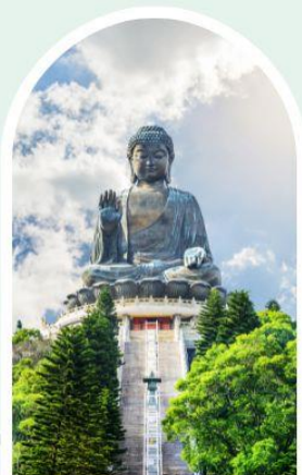
พระใหญ่โป่หลิน