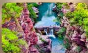
อุทยานหยุ่นโตซาน