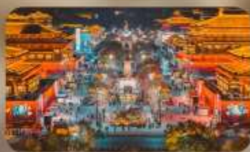
ถนนวัฒนธรรมราชวงศ์ถัง