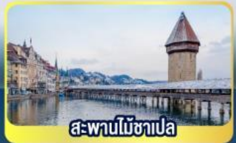
สะพานไม้ซาเปลา