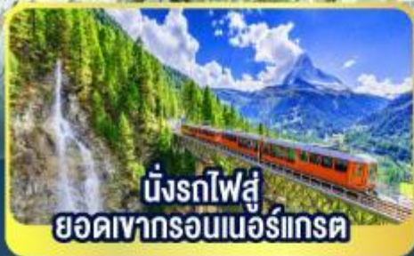
นั่งรถไฟสู่อยอดเขากรอนเนอร์เกรต