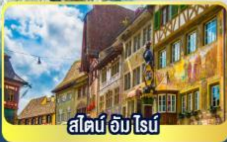
สไตน์ อัม ไรบ์