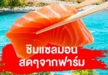
ชิมแซลมอน สดๆจากฟาร์ม