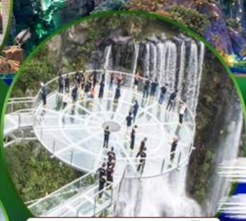
สะพานแก้วถล่มเขี้ยว