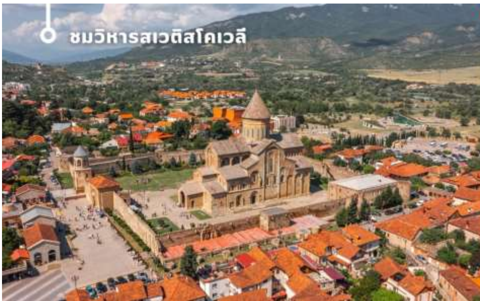
ชมวิหารสเวติสโคเวลี

นำท่านออกเดินทางชม วิหารสเวติสโคเวลี (Svetitskhoveli Cathedral) โบสถ์เก่าแก่ที่ถือเป็นศูนย์กลางทางศาสนาอันศักดิ์สิทธิ์ที่สุดของจอร์เจีย มีขนาดใหญ่เป็นอันดับสองของประเทศ และเป็นศูนย์รวมจิตใจของชาวคริสต์ออร์ทอดอกซ์สร้างขึ้นในราวศตวรรษที่ 11 ตัวโบสถ์มีสถาปัตยกรรมที่งดงามตามแบบฉบับของจอร์เจีย โดมสูงเด่นตระหง่าน บ่งบอกถึงความยิ่งใหญ่และศักดิ์สิทธิ์ ภายในวิหารประดับประดาด้วยภาพเขียนฝาผนังที่งดงามเล่าเรื่องราวทางศาสนา และยังมีหอคอยสูงที่สามารถมองเห็นวิวเมืองมิชเคต้าได้อย่างสวยงาม