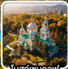
ทาสกันตอฟ

นั่งกระเช้าคอนโดล่าขึ้นสู่ชิมบูลัก สทึร์สออร์ก ไร่มุกแห่งเทือกเขาเทียนชาน ทะเลสาบโคลไซ หุบเขาเจดี โอกูช / ภูเขาหินเทพนิยาย / ทะเลสาบอัสซิกกุล ชมการแสดงการล่าเหยื่อของนกอินทรี