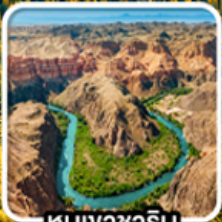
หุนนาซาริน