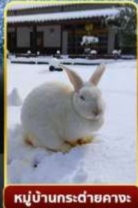
หมู่บ้านกระต่ายคางะ