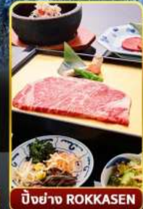
ปิ้งย่าง ROKKASEN

ออนเซ็น 3 คั้น มน.กระเป๋า 1 ใบ 23 กก 9Days 6Night