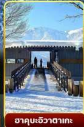
ฮาคุบะอิวาตาคะ