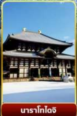
นาราโกไดจิ

พิเศษพักในเมืองคุสัทสึออนเซ็นพร้อมชมยูบาคาเกะ