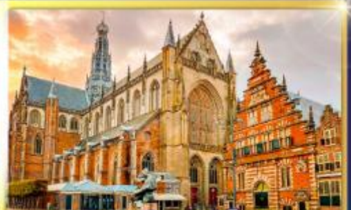
จัตุรัสเมืองฮาร์ลิม

พรมแดนเมืองแปลกเนเธอร์แลนด์และเบลเยียม เดินเมืองเคลฟท์ เมืองเครื่องปั้นดินเผาระดับโลก ฮาร์ลิมเมืองมั่งคั่งที่สุดของเนเธอร์แลนด์