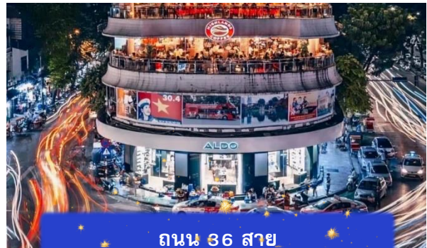
ถนน 36 สาย