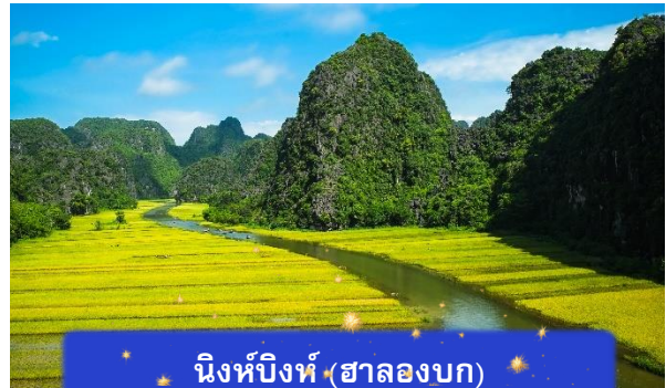
นิงห์บิงห์ (ฮาลองบก)