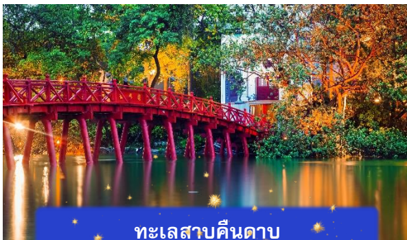
ทะเลสาบคินดาบ

เย็น บริการอาหารค่ำ ณ ภัตตาคาร พิเศษ ... เมนูแหมมเนือง + บุนจ๋า ที่พัก A25 HOTEL ระดับ 4 ดาวมาตรฐานท้องถิ่น หรือเทียบเท่า