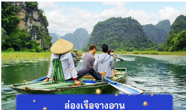
ล่องเรือจางอัน