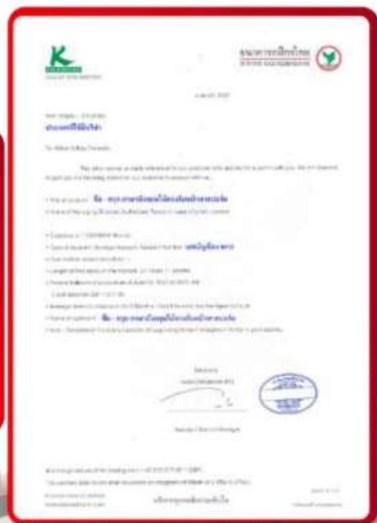
ตัวอย่าง Bank Guarantee ที่ผู้สมัครต้องยื่นธนาคาร